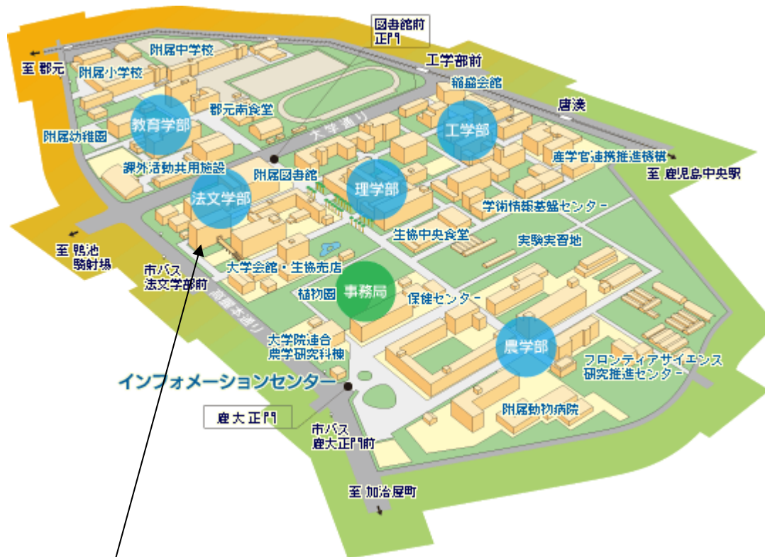
鹿児島大学総合教育研究棟